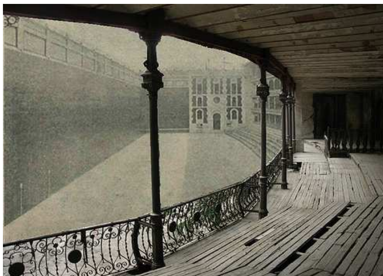
Beti Jai Fotomontaje 1894-2008

¿Y en lo deportivo? El fenómeno sociológico del deporte moderno, de origen inglés, tiene una tímida aunque progresiva penetración en España desde finales del s. XIX y durante el primer tercio del s. XX. Me refiero a los deportes convencionales hoy al uso tanto en su vertiente de práctica como de espectáculo de masas. Hasta los años 60 / 70 puede decirse, grosso modo , que la integración de la Educación Física en el sistema escolar y la práctica deportiva generalizada en el tejido social de España apenas se había enraizado. Y sin embargo se produce un fenómeno curioso que tiene precisamente como protagonista a nuestro deporte del Juego de Pelota en todas sus expresiones.