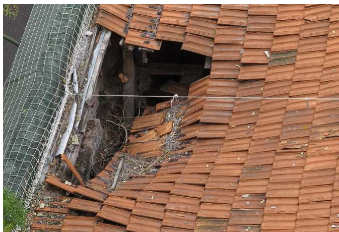
Estado de la cubierta del Beti-Jai en 2014

Procede ahora, más bien, ponerse al día sobre el estado de la cuestión justo cuando se cumplen dos años –9 de febrero de 2011- de la declaración de BIC, y estamos a las puertas de celebrar su 120 aniversario: 29 de abril de 1894.