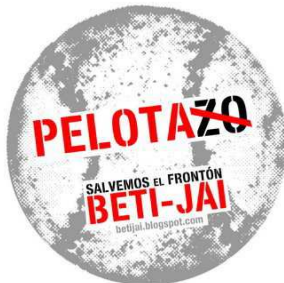
Pelota SI, Pelotazo NO